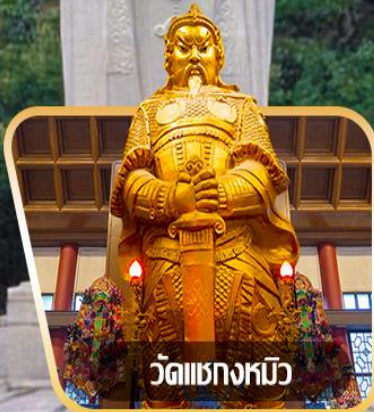
วัดเขangkงมียว