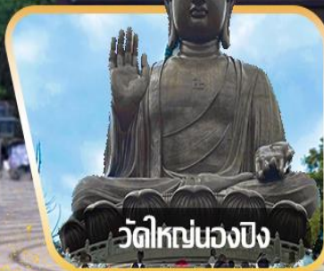
วัดใหญ่หนองบึง