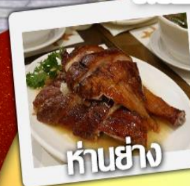
ก้านย่าง