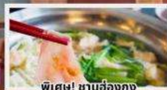
พิเศษ! ซาบูฮ่องกง