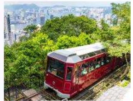
รถรางพิกแกรม