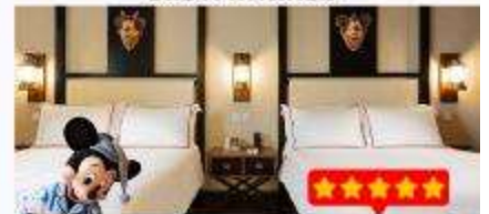
พนัก Disney Explorers Lodge 5 ดาว 1 คืน