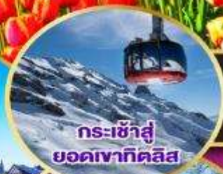
กระเช้าสู่ออกเขาทาคาลิส