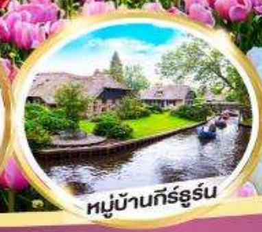
หมู่บ้านกึร์ธูร์น