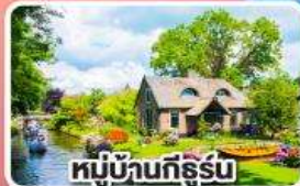
หมู่บ้านที่รัฐัน

พักปารีสและอัมสเตอร์ดัม อย่างละ 2 คืน ไม่ต้องเปลี่ยนโรงแรมบ่อย