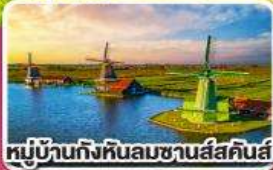
หมู่บ้านกังหันลมชาเนลส์คินส์