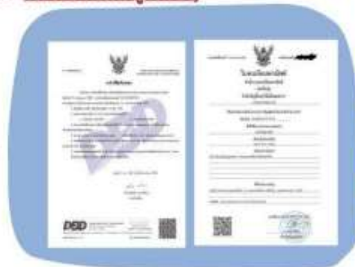
ตัวอย่างหนังสือจดทะเบียนบริษัท และ ใบทะเบียนพาณิชย์