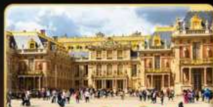
พระราชวังแวร์ซาย