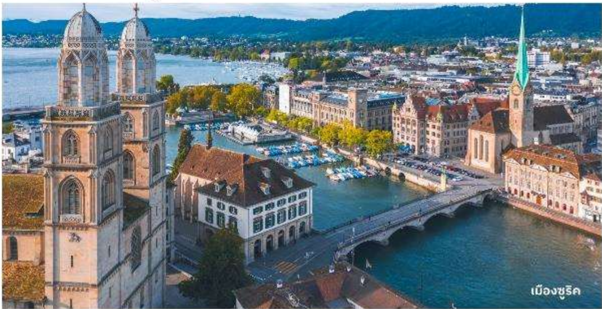
เมืองซูริก

จากนั้นนำท่านลงจากยอดเขาและเดินทางต่อไปยัง เมืองซูริก ใช้เวลาเดินทางประมาณ 1 ชั่วโมง นำท่านเที่ยวชม จัตุรัสพาราเดพลาทซ์ (Paradeplatz) จัตุรัสเก่าแก่ที่มีมาตั้งแต่สมัยศตวรรษที่ 17 ในอดีตเคยเป็นศูนย์กลางของการค้าสัตว์ที่สำคัญของเมืองซูริก ปัจจุบันจัตุรัสนี้ได้กลายเป็นชุมทางรถไฟที่สำคัญของเมืองและยังเป็นศูนย์กลางการค้าของย่านธุรกิจ ธนาคาร สถาบันการเงินที่ใหญ่ที่สุดในประเทศสวิตเซอร์แลนด์ นำท่านแวะถ่ายรูปกับ โบสถ์ฟรอมมุนสเตอร์ (Fraumunster Abbey) จากบนสะพานมุนสเตอร์บรูค เป็นโบสถ์ที่มีชื่อเสียงของเมืองซูริก สร้างขึ้นในปี ค.ศ. 853 โดยกษัตริย์เยอรมันหลุยส์ ใช้เป็นสำนักแม่ชีที่มีกลุ่มหญิงสาวชนชั้นสูงจากทางตอนใต้ของเยอรมันอาศัยอยู่ นำท่านสู่ ถนนบาห์นโฮฟชตราสเซอร์ (Bahnhofstrasse) เป็นถนนอันลือชื่อที่มีความยาวประมาณ 1.4 กิโลเมตร เป็นถนนที่เป็นที่รู้จักในระดับนานาชาติ ว่าเป็นถนนช้อปปิ้งที่มีสินค้าราคาแพงที่สุดแห่งหนึ่งของโลก ตลอดสองข้างทางล้วนแล้วแต่เป็นที่ตั้งของห้างสรรพสินค้า ร้านค้าอัญมณี ร้านเครื่องประดับ ร้านนวดสปาและโรงแรมระดับหรู อิสระให้ท่านเดินเล่นและเลือกซื้อสินค้าตามอัธยาศัย ได้เวลาอันสมควรนำท่านสู่สนามบิน