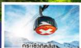
กระเช้ากิตติลิส