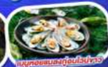
เมนูหอยแมลงภู่อบไวน์ขาว