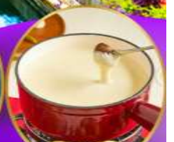
ฟองดูชีส