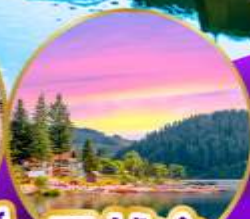
ทิทเซ่ ปาด่า