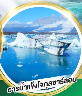
ธารน้ำแข็งโจกุลชาร์ลอน