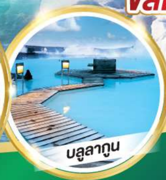
บลูลาทูน