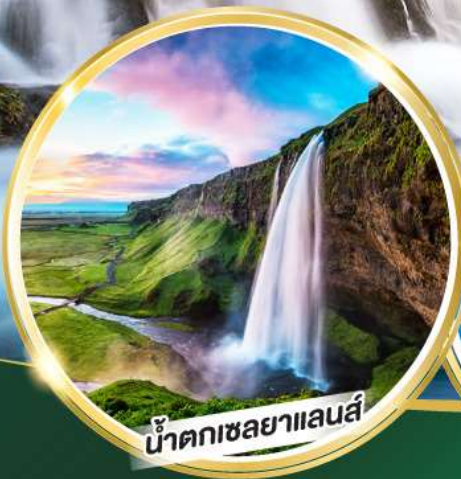
น้ำตกเซลยาแลนส์