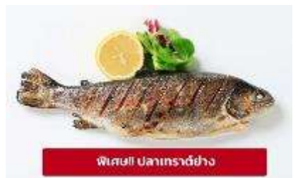
พิเศษ! ปลาเทราต์ย่าง

เกี๊ยง 🍷 รับประทานอาหารเกี๊ยง (มื้อที่6) เมนูพิเศษ ปลาเทราต์ย่างท่านละ 1 ตัว นำท่านเดินทางสู่ เมืองมรดกโลกเชสกี คุรมลอฟ (Cesky Krumlov) สาธารณรัฐเช็ก (ระยะทาง 210 กม./ 3.30 ชม.) ล้อมรอบด้วยแม่น้ำ Vltava ทำให้เมืองแห่งนี้มีลักษณะคล้ายหยดน้ำ จนถูกขนานนามว่าเป็น "เมืองหยดน้ำ" จากนั้นนำท่านถ่ายรูปบริเวณนอก ปราสาทคุรมลอฟ (Cesky Krumlov Castle) เป็นปราสาทกอธิคดั้งเดิม ตั้งอยู่ริมฝั่ง