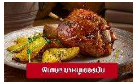
พิเศษ!! ขาหมูเยอรมัน

ที่พัก : Hotel Goldenes Schiff หรือโรงแรมระดับใกล้เคียงกัน (ชื่อโรงแรมที่ท่านพัก ทางบริษัทจะทำการแจ้งพร้อมใบนัดหมาย 5-7 วัน ก่อนวันเดินทาง)