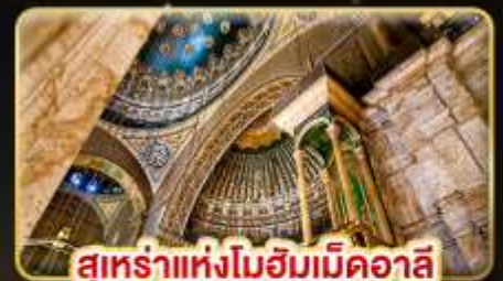
สุทรร้าแห่งโมฮั้มเบ็ดออลึ

🧳 น้ำหนักกระเป๋า 23Kg. (ใบระห่างัร-กัะทั่กั และบึนท่ายใ้บ)