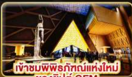
เข้าชมพิพิธภัณฑ์แห่งใหม่ ของยิปต์ GEM

ชม 1 ใน 7 สิ่งมหัศจรรย์ของโลก “มหาพีระมิดแห่งกิซ่า”