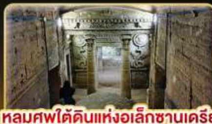
ทลุมศฟใ้ตั้ดินแห่งอลึกซานเดรีย