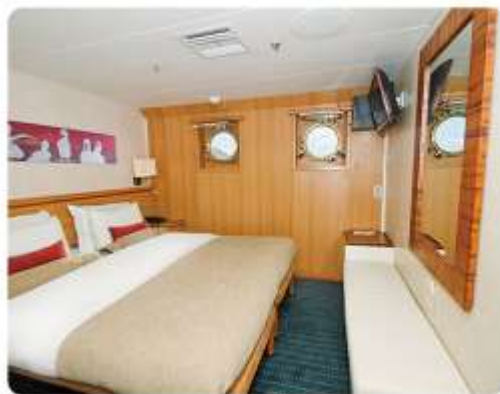
Junior Suite Plus & Junior Suite