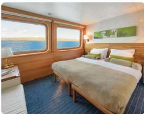
Junior Suite Plus & Junior Suite