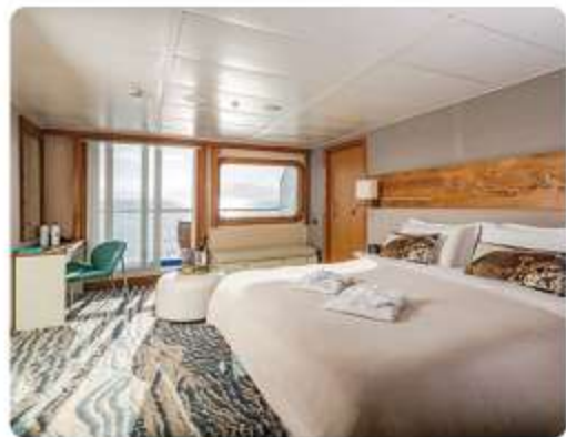
Balcony Suite Plus & Balcony Suite