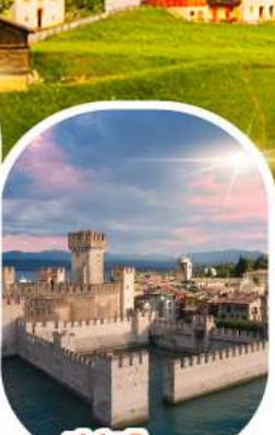
ซิร์มีโอเน