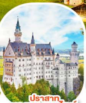
ปราสาท นอยชวานชไตน์