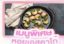
เมนูพิเศษ หอยออสตาโก้

เยอรมัน เนเธอร์แลนด์ เบลเยียม ฝรั่งเศส Keukenhof