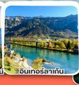
อินเทอร์ลาเก็น