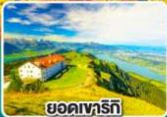
ยอดเขารัทท์