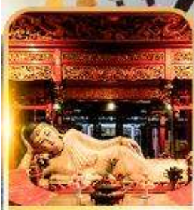
วัดพระหยกขาว