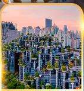
Tian An 1000 Trees