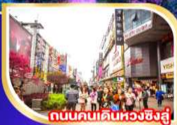
ถนนคนเดินหวงซิงอู่