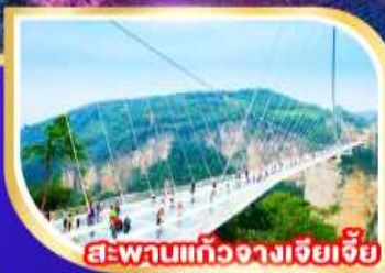
สะพานแก้วจางเจียเจีย