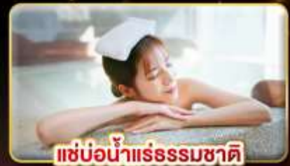
แช่น้ำแร่ธรรมชาติ