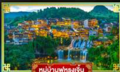
หมู่บ้านฟุรงเจิน