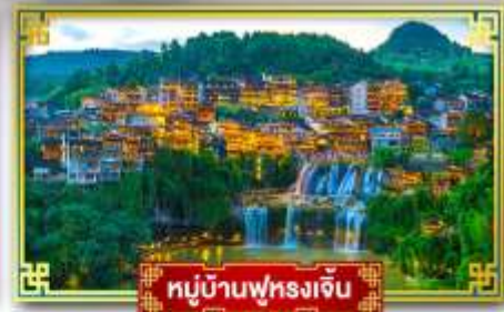
หมู่บ้านฟุรงเจิน