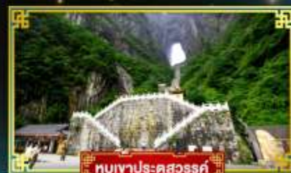
อุทยานประตูสวรรค์