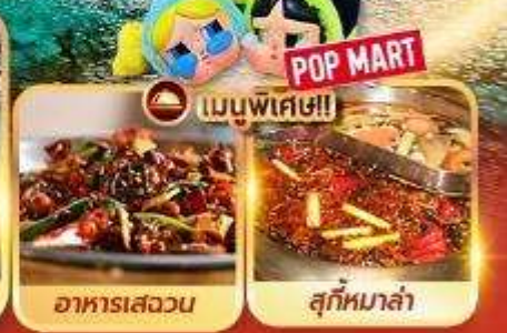
อาหารเสววน