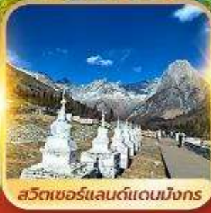
สวิตเซอร์แลนด์แดนมิงกร