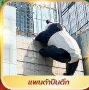
แพนด้าปิ่นตึก