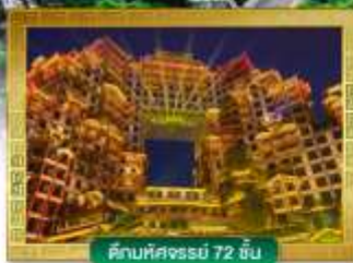
ตึกมหัศจรรย์ 72 ชั้น