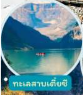
ทะเลสาบเต๋ยซี