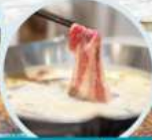
เมนูพิเศษ สุกี้ห่มล่า