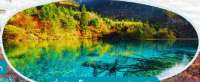
จิวจ้ายโกว รวมรถส่วนตัว