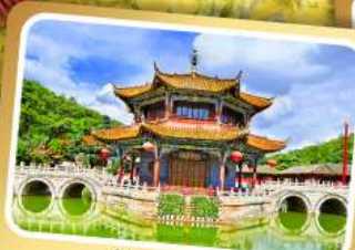
วัดห้วยนอง