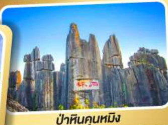
ป่าหินคุณหมิง