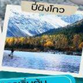
ปี้ผิงโกว