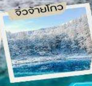
จิวจ้ายโกว