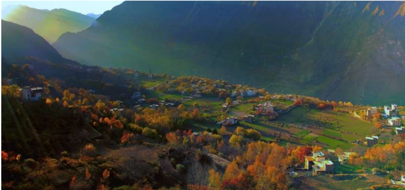
Photo shows the picturesque autumn scenery of Danba county, southwest China's Sichuan Province.

นำท่านนั่งรถของอุทยาน เข้าสู่ ซวงเฉียวโกว หรือ หุบเขาสะพานคู่ มีระยะทาง 34.8 กม. มีพื้นที่รวม 216 ตารางกิโลเมตร จุดท่องเที่ยวแบ่งออกเป็น 3 ส่วน ส่วนแรก หุบเขาหิ้นหยาง หุ่นต้นหยาง แล้วเดินทางเข้าสู่ส่วน ลึกสุดท่านจะได้เห็นธารน้ำแข็ง ภูเขากระจกแก้ว ภูเขาดวงอาทิตย์ ภูเขาดวงจันทร์ ยอดเขากระต่าย ส่วนกลาง นำท่านย้อนกลับมาชมทะเลสาบ ส่วนที่สาม นำท่านชมทุ่งหญ้าเหนียนหยูป่า ชมยอดเขารูปร่างแปลกตา เช่น ยอดเขาพราน ยอดวังโปตาลา ยอดเขาเพชร ภูเขาหญิงตั้งครรภ์ ถ่ายรูปกันอย่างจุใจกับท้องทุ่งกว้างที่มีฉากหลัง เป็นภูเขาสูงปกคลุมด้วยหิมะขาว ในหุบเขาจะมีลำธารใสสะอาด และสนสูงสีเขียวเข้มสลับด้วยต้นไม้หลายหลาก เฉดสี เช่น เขียวอ่อน เขียวแก่ เหลืองส้ม แดง น้ำตาลเข้ม เนื่องจากอยู่ในฤดูกาลใบไม้เปลี่ยนสี