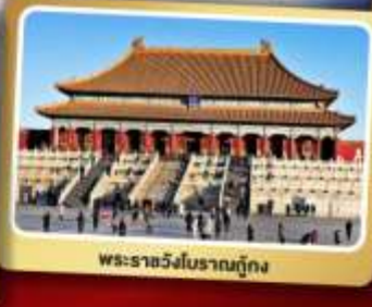
พระราชวังโบราณปักกิ่ง