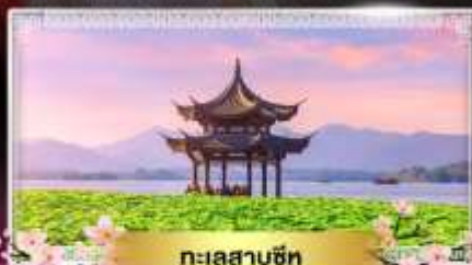
ทะเลสาบซีหู