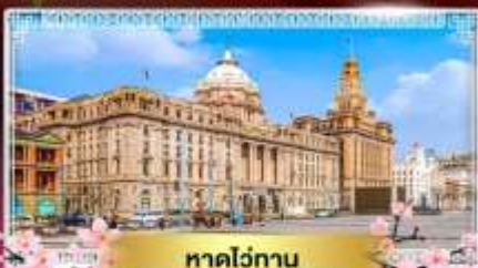
หาดว่อกาน

"ชมดอกซากุระที่สวนลิชาน ถนนแดนมังกร" ล่องเรือทะเลสาบตะวันตก ไข่มุกแห่งหางโจว