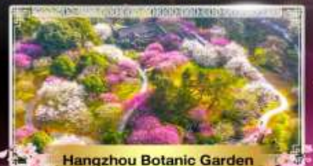
Hangzhou Botanic Garden