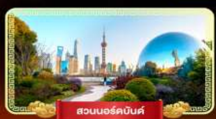
สวนนอร์คบันด์