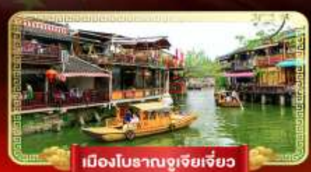
เมืองโบราณจูเจียเจี้ยว

เที่ยวสวนสนุกในฝัน "ดิสนีย์แลนด์" ล่องเรือชมเมืองโบราณจูเจียเจี้ยว