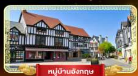
หมู่บ้านอังกฤษ