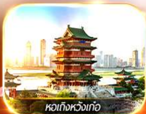
หอเท็งหวังเทื่อ