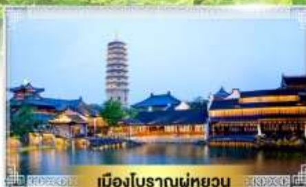
เมืองโบราณฟู่หยวน