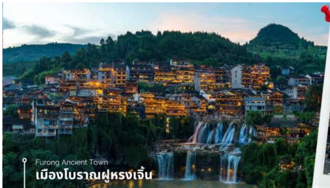
Furong Ancient Town

นำท่านเที่ยวชม เมืองโบราณผู่หรงเจิ้น เมืองโบราณเก่าแก่ที่ขึ้นชื่อ ของมณฑลหูหนานเป็นสถานที่ท่องเที่ยวระดับ AAAA ที่ได้รับความนิยมจากนักท่องเที่ยวคู่กับเมืองโบราณฟงหวง เคยเป็นสถานที่ถ่ายทำภาพยนตร์เรื่อง ผู่หรงเจิ้น ทำให้สถานที่แห่งนี้