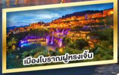
เมืองโบราณฝูหลงเจิ้น