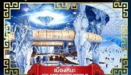
เมืองหิมะ ICE AND SNOW WORLD