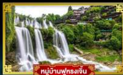
หมู่บ้านฟุทงเจี้ยน