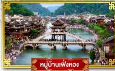
หมู่บ้านเฟิ่งหวง