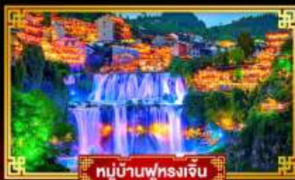
หมู่บ้านฟุทงเจิ้น