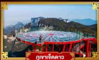
กุเขาเจ็ดดาว