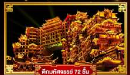
ตึกมหิศจรรย์ 72 ชั้น