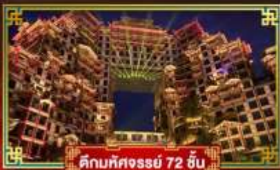
คัมภีร์ศงจรัญ 72 ชั้น

นั่งกระเช้าขึ้นประตูสวรรค์ เทียวหมู่บ้านโบราณ