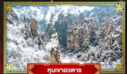
หมู่บ้านจางตาร