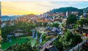
เมืองโบราณฟูหรงเจิน