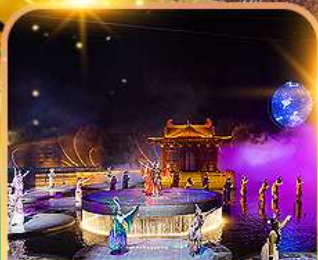
โชว์แสงสีที่อู๋หนี่โจว