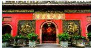
วัดต้าเจี๊ว