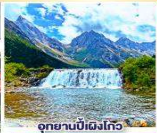
อุทยานปี้เผิงโกว