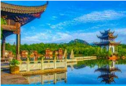
หมู่บ้านโบราณ สุ่มั่วซังเหอ