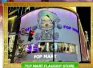
POP MART FLAGSHIP STORE