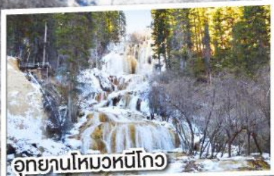
อุทยานโหมวหนี่โกว