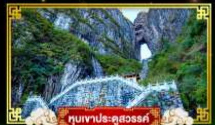
หุบเขาประตูสวรรค์