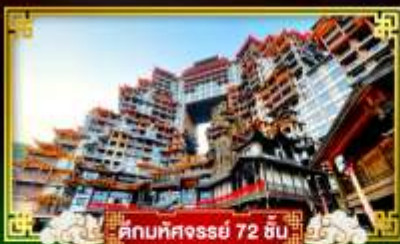
คตบาศศวรรษ 72 ชั้น