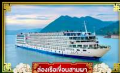
ล่องเรือเขื่อนสามผา