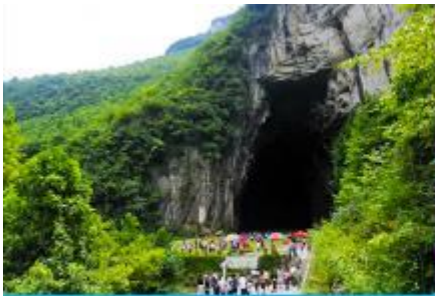
ถ้ำผญามังกร

พักที่ YICHANG HUIHAO HOTEL โรงแรมระดับ 4 ดาวหรือเทียบเท่าในเมืองหฺยซัง