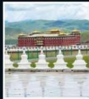
วัดต้ากง