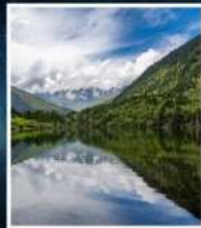
อุทยานมู่เก้อจิว