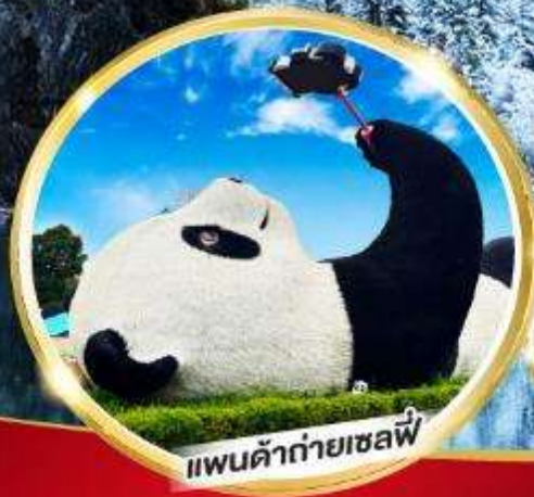
แพนด้ายักษ์เซลฟี