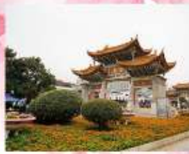
ประตูกำแพงเมืองฟ้า